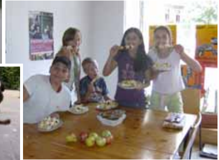
Ob „Hüpfen nach Zahlen“, Obstspieße herstellen oder Fußball – die Spielplatzbetreuung hat viele interessante Angebote parat.

Dadurch konnte die Finanzierung für sechs Wochen gesichert werden. Jetzt ist es BürSte e.V. und Olle Burg e.V. ein großes Anliegen, dafür zu sorgen, dass die Spielplatzbetreuung auch nach dieser Zeit und vor allem im nächsten Jahr weitergeht.