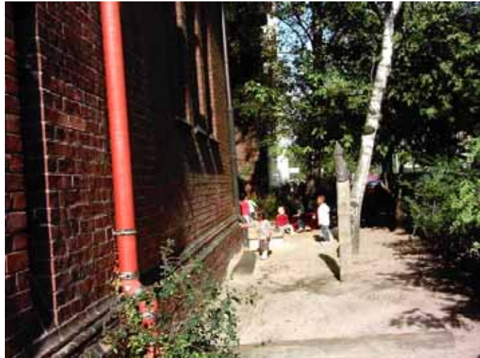
Der Außenbereich der Kita Birkelinchen