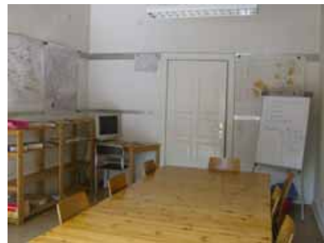
Unverkennbar mit der Bürste und den Blumenkästen vor dem Schaufenster: der Stadtteilladen in der Stephanstraße 26, in dem auch die Kieztreffen stattfinden